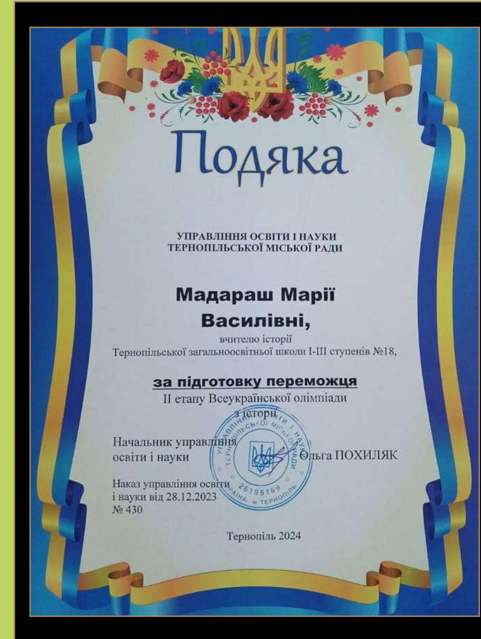
Подяка за підготовку переможця II етапу Всеукраїнської учнівської олімпіади з історії