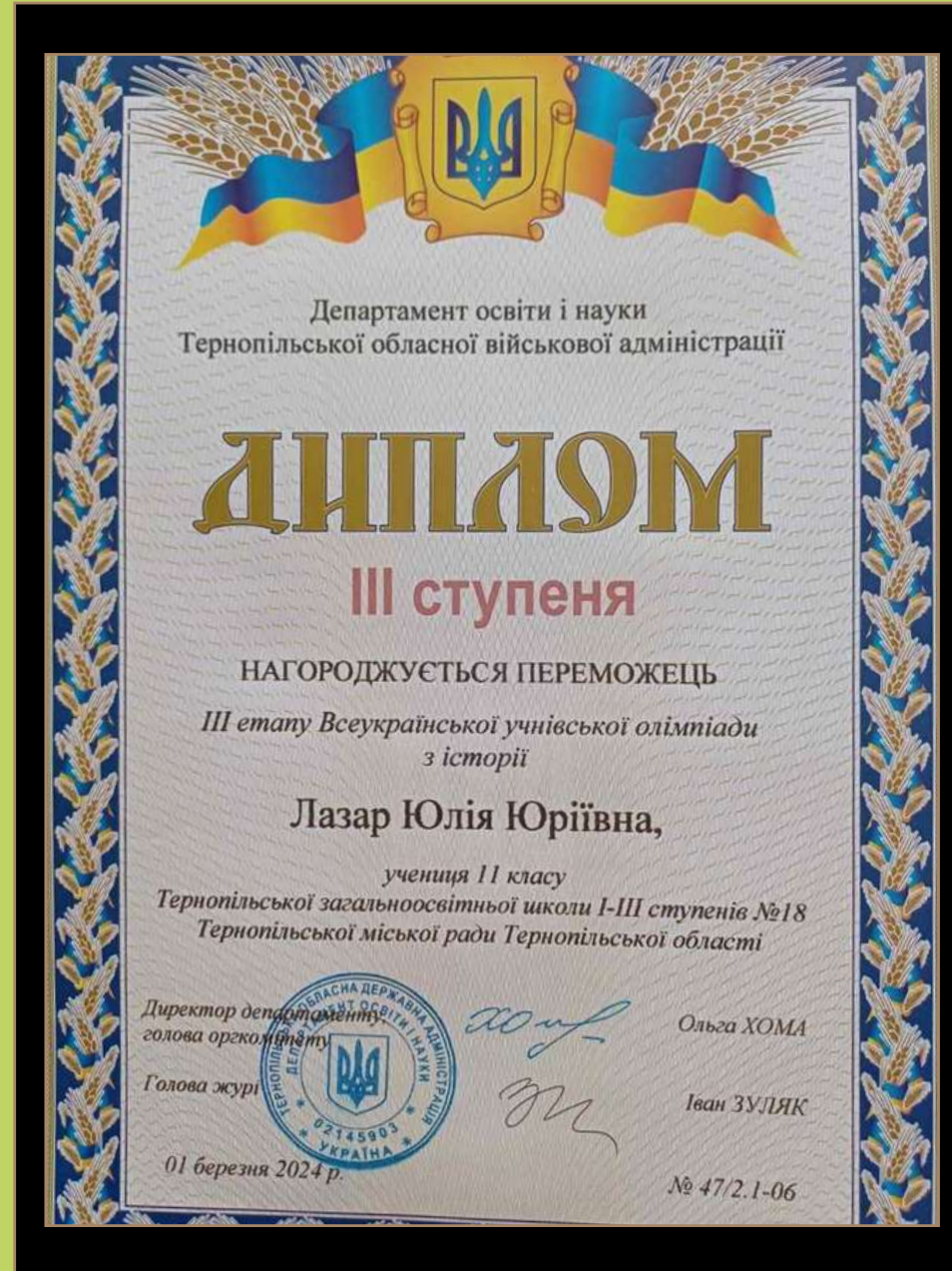
Диплом III ступеня III етапу Всеукраїнської учнівської олімпіади з історії