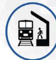
Виведення з ладу критично важливих магістралей