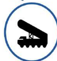
Розвідка військових позицій