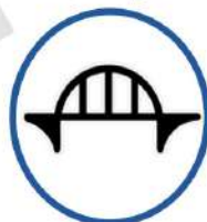
Фото критичної інфраструктур и