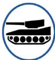
Фіксація пересування військ