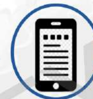
Використання смартфон-ігор у власних цілях